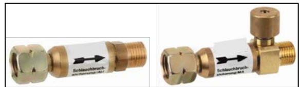
Bild 4 Schlauchbruchsicherungen