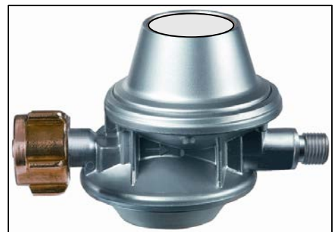
Bild 3 Druckregelgerät („S2SR“) zum Anschluss an 11 kg Flüssiggasflasche