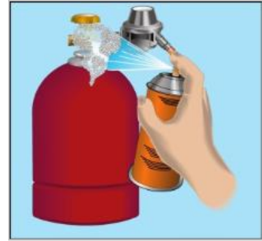
Bild 5 Dichtheitsprüfung der Anschlussverbindung