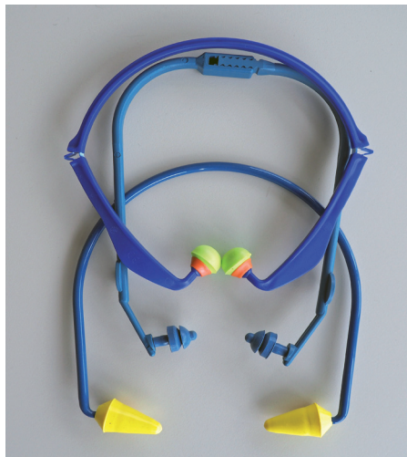
Abb. 2: Bügelgehörschutz in verschiedenen Ausfertigungen

Übrigens: Wenn der Bügel mit der Kleidung oder anderen Gegenständen in Berührung kommt, entstehen unangenehm laute Geräusche. Dies kann merklich zur Gesamt-lärmbelastung beitragen.