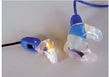
Abb. 4: Otoplastiken in zwei verschiedenen Ausfertigungen

Otoplastiken werden individuell auf die Ohrmuschel und einen Teil des Gehörganges des Benutzers angepasst. Sie werden aus Silikon, Nylon oder Acryl gefertigt (Hart- oder Weichotoplastik) und unterscheiden sich z. B. hinsichtlich Tragekomfort, Reinigbarkeit und Lebensdauer.