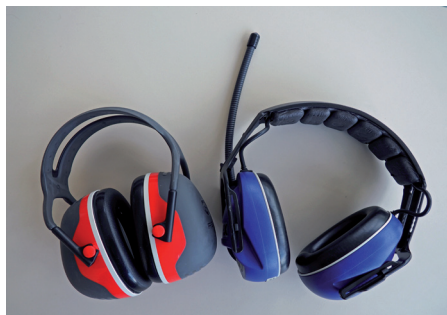
Abb. 3: Kapselgehörschützer, rechts mit Funkempfänger, z. B. für Sprach- oder Musikübertragung

Kapselgehörschutz wird mit und ohne elektronische Zusatzeinrichtungen angeboten. Dazu gehören z. B. Funkverkehr oder Musikempfang. Weiterhin kann eine pegelabhängige Schalldämmung realisiert werden (siehe Kapitel 4.6).